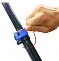
Pour serrer, visser dans le sens des aiguilles d'une montre.