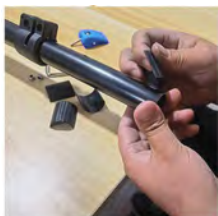
Joint de montage