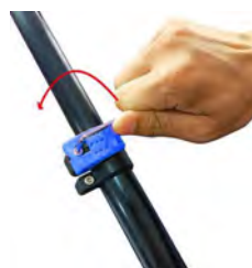
Pour desserrer, dévisser dans le sens anti-horaire.