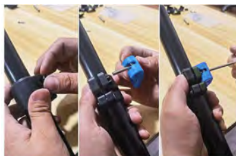
Serrer la vis pour obtenir une étanchéité adéquate