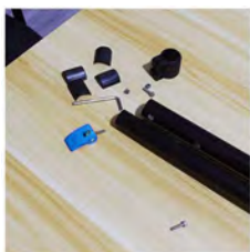
Organiser les pièces