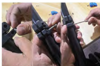
Serrer les vis