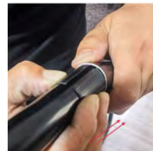
Les nervures sur le tube intérieur