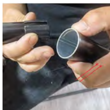
Orientation des nervures du tube