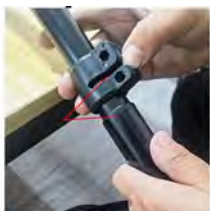
Placer le verrouillage dans la position indiquée sur l'image